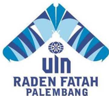
Gambar 1.1 Lambang UIN Raden Fatah Palembang

Salah satu ciri dari sebuah lembaga perguruan tinggi adalah lambang yang dimiliki oleh perguruan tinggi tersebut. Lambang yang dimiliki menjadi salah satu dasar bagi pengembangan UIN Raden Fatah pada masa mendatang. Gambar lambang UIN Raden Fatah Palembang dapat dilihat pada Gambar 1.1.